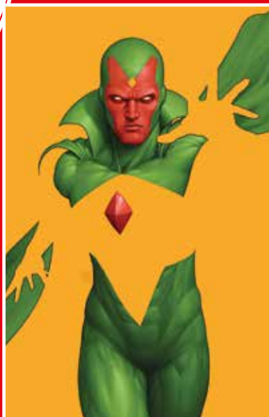
COPERTINA VARIANT DI JOHN TYLER CHRISTOPHER