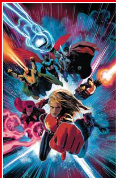
COPERTINA VARIANT DI DANIEL ACUÑA

*Le 5 variant avranno la stessa tiratura.