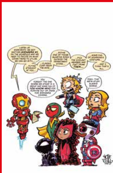
COPERTINA VARIANT DI SKOTTIE YOUNG