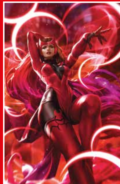
COPERTINA VARIANT DI DERRICK CHEW