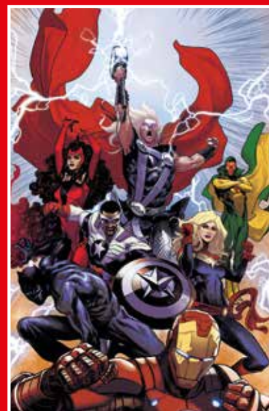
COPERTINA VARIANT DI MARCO CHECCHETTO

PANINI DIRECT AVENGERS 1 MULTIVARIANT PACK